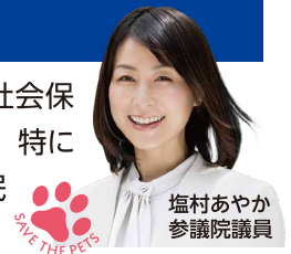
塩村あやか 参議院議員