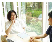
学生の進学相談にのったり、議論したりするひときが好きです。