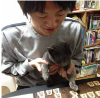
▲チキンと一緒に将棋を ▲黒板の前に立つと 気が引き締まります